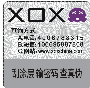
机身底部防伪签图样

客所思使用了高强度系统，在产品包装盒侧面和机壳背面，均贴有一张产品防伪签，购买到客所思产品后，一定要刮开此防伪签，获取4段5位（共20位）防伪序列码，注意刮的时候不要用力过猛，也不可过于锋利的刀片去刮，以免损伤防伪签。