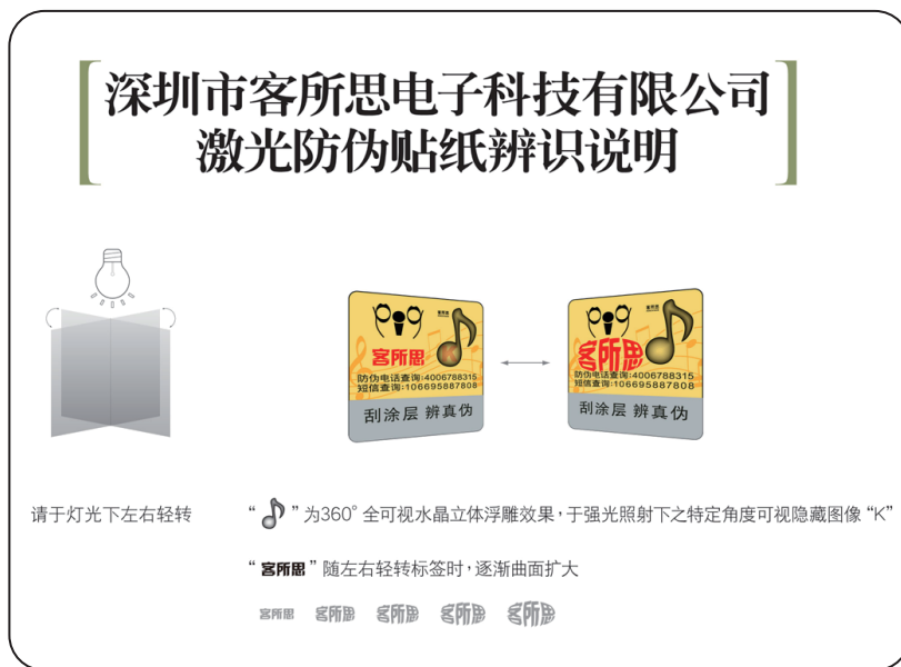
包装盒侧面防伪签辨识说明

★ 注意 ，若某个号码被查询超过1次，则在第n次查询时，系统提示信息则会追加提示：该产品已经被n-1次查询，请当心买到假货。凡是碰到所查询号码并非首次查询的情况，请与客所思客服联系以确定产品的真伪！