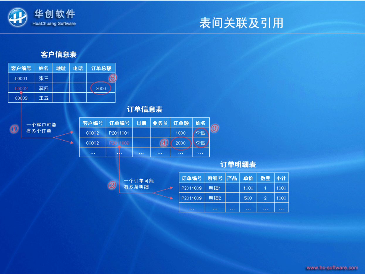
图 4：表间关系示意图

表与表之间，既可相互独立，也可建立关联，并相互引用数据。比如，客户表、订单表、订单明细表之间的关系是：一个客户有多个订单，一个订单有多条明细，如下图所示：